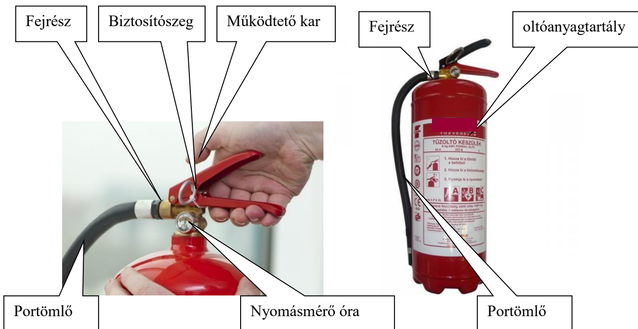
1. kép Porral oltó készülék részei.

Oltóanyagtartály, valamint a készülék fejrésze.