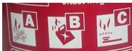
2. kép 'ABC' Porral oltó készülék piktogramjai.

Az oltóanyagtartályon elhelyezett címkéken a használati utasítás, valamint, a készülékbe töltött oltópor típusa olvasható le. (2.kép)