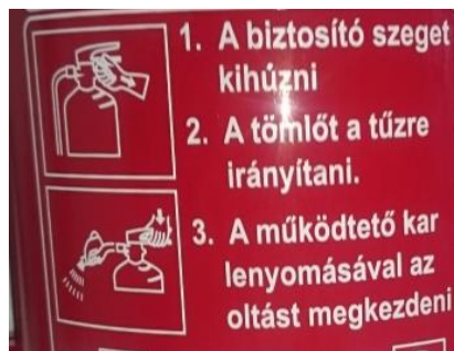
3. kép Porral oltó készüléken lévő használati utasítás és annak piktogramjai.

Az oltóanyagtartályon elhelyezett címkéken magyar nyelvű kezelési és használati utasítás olvasható, látható, ami közérthető ábrával is el van látva. (3.kép)