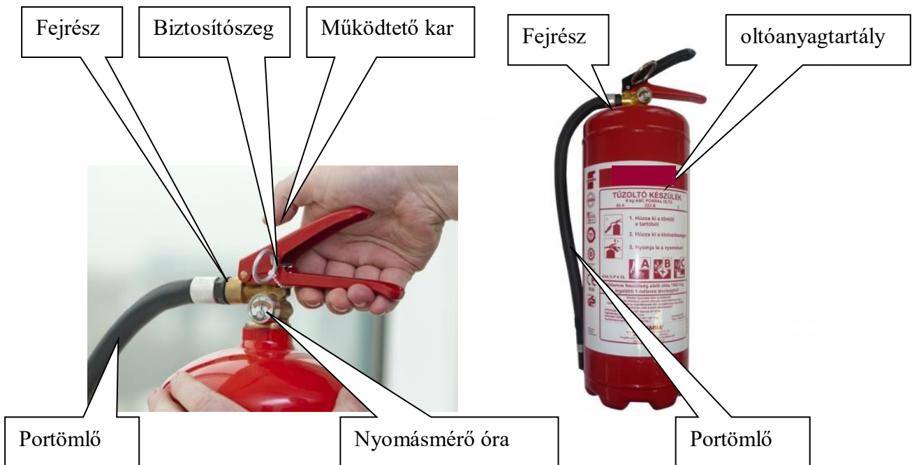
1. kép Porral oltó készülék részei.

Oltóanyagtartály, valamint a készülék fejrésze.