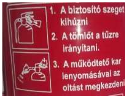
3. kép Porral oltó készüléken lévő használati utasítás és annak piktogramjai.

Az oltóanyagtartályon elhelyezett címkéken magyar nyelvű kezelési és használati utasítás olvasható, látható, ami közérthető ábrával is el van látva. (3.kép)