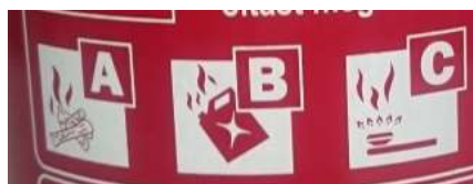
2. kép 'ABC' Porral oltó készülék piktogramjai.

Az oltóanyagtartályon elhelyezett címkéken a használati utasítás, valamint, a készülékbe töltött oltópor típusa olvasható le. (2.kép)