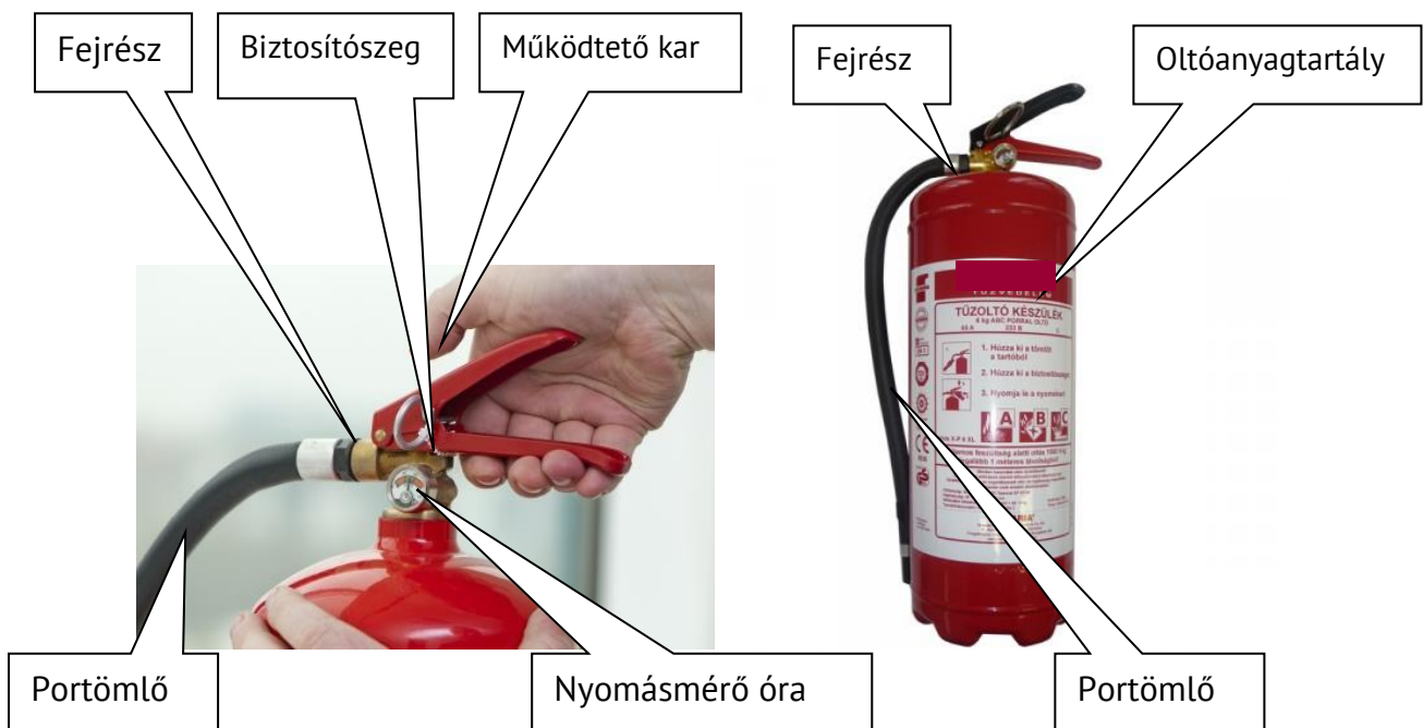
1. kép Porral oltó készülék részei.

Oltóanyagtartály, valamint a készülék fejrésze.