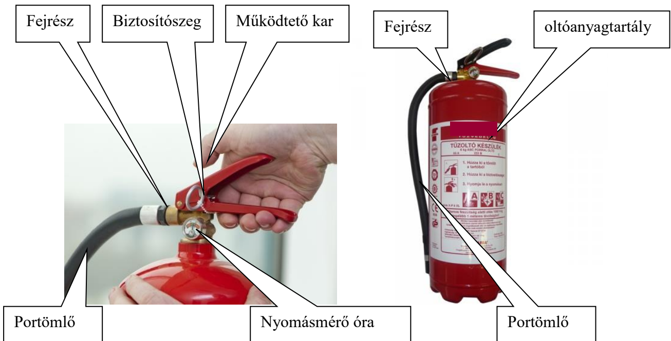
1. kép Porral oltó készülék részei.

Oltóanyagtartály, valamint a készülék fejrésze.